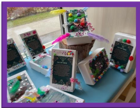
Doosjes groep 1/2 a en b ons fantasieland

Wat hebben we heerlijk weer gehad in de voorjaarsvakantie! De meesten konden even lekker bijkomen, om deze week weer fris aan de slag te gaan. Helaas waren er ook nog best veel zieken, dus gold dit niet voor iedereen.