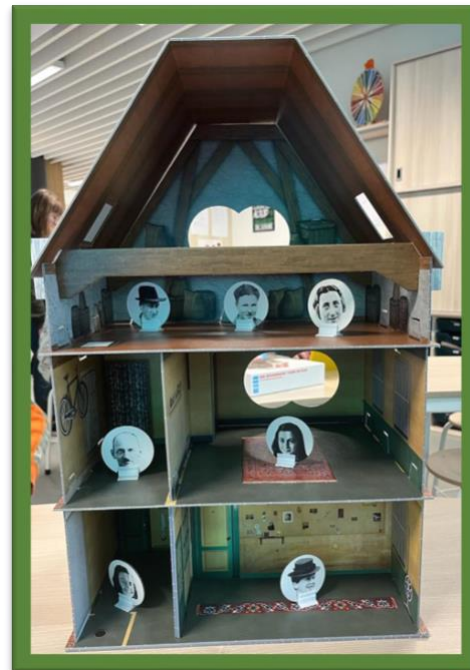
Anne Frank huis n.a.v. geschiedenis Bovenbouw