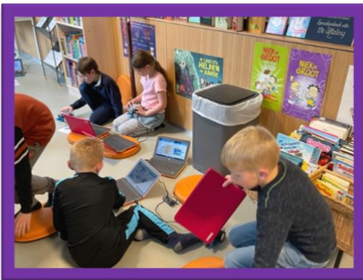
Programmeren met de M-Bot Middenbouw

Wettelijk hebben kinderen tijdens hun basisschooltijd recht op 7520 uur onderwijs. Het aantal uren dat kinderen te veel naar school gaan wordt in de 8 schooljaren voor een deel gecompenseerd door margedagen. Afhankelijk van het schooljaar hebben we meer/minder margedagen. Soms hebben we vroeg of later zomervakantie, soms vallen verplichte vrije dagen (bijvoorbeeld 28 augustus) doordeweeks, waardoor het aantal margedagen verschilt van het schooljaar ervoor of er na. De planning van de margedagen gebeurt altijd met goedkeuring van de Medezeggenschapsraad. Op de margedagen zullen leerkrachten hun compensatie opnemen en werken aan de niet-lesgebonden taken, zoals scholing, les/themavoorbereidingen, rapportage, etc. Zij zijn dus niet vrij. De margedagen staan in de jaarkalender en vermelden we ook steeds in de nieuwsbrief.