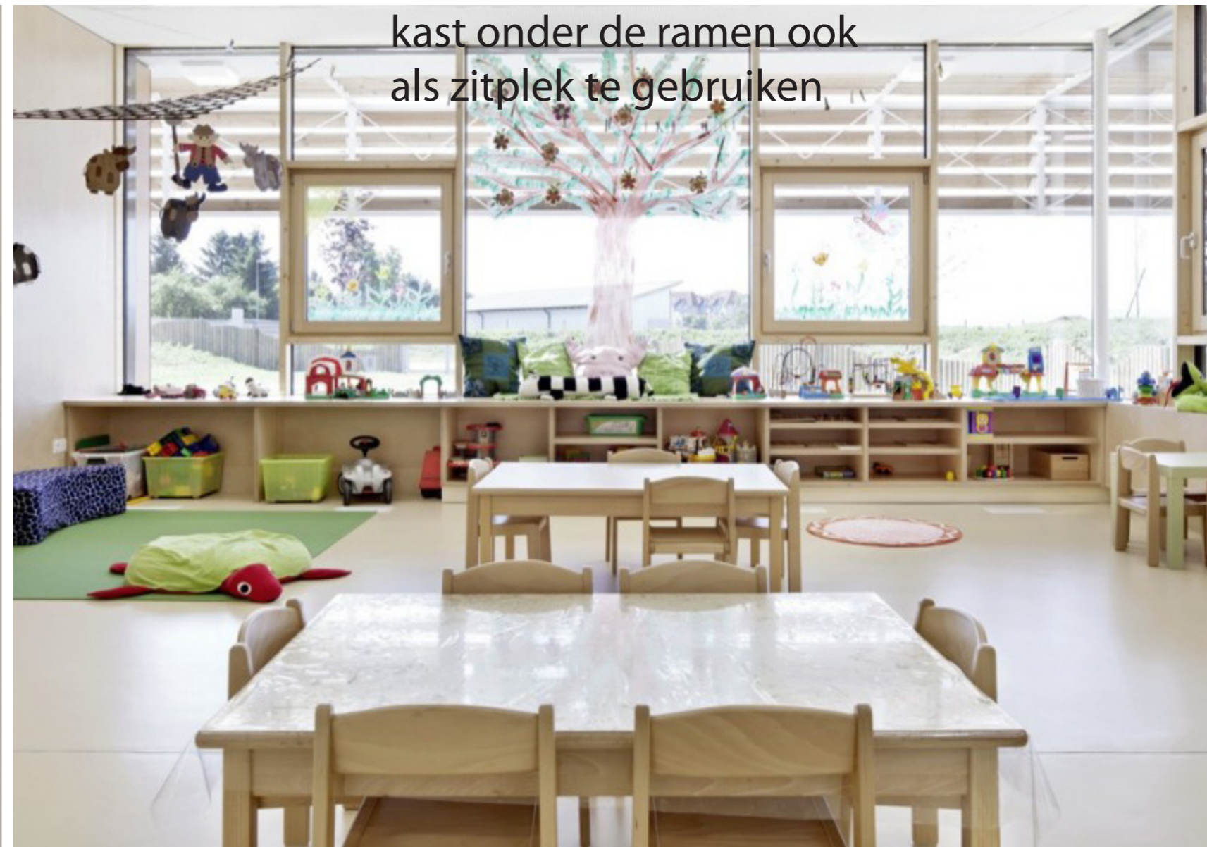
kast onder de ramen ook als zitplek te gebruiken