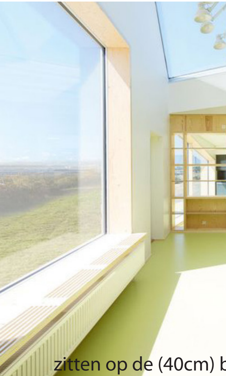
zitten op de (40cm) brede vensterbank